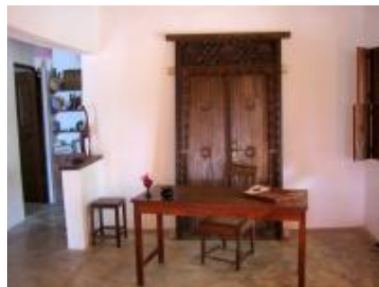
Schreibplatz im Wohnzimmer